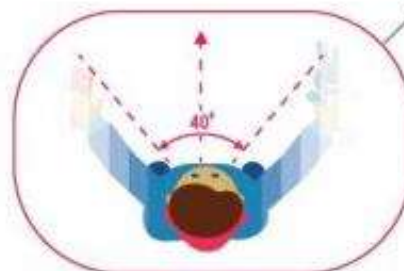
ОПАСНОЕ ТУННЕЛЬНОЕ ЗРЕНИЕ

При переходе проезжей части обязательно держите ребёнка за руку и первым делом научите разворачиваться и смотреть по сторонам: сначала налево, потом направо, а дойдя до середины дороги – снова направо!