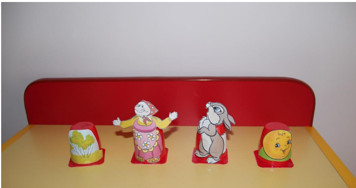
На пластиковых стаканчиках.