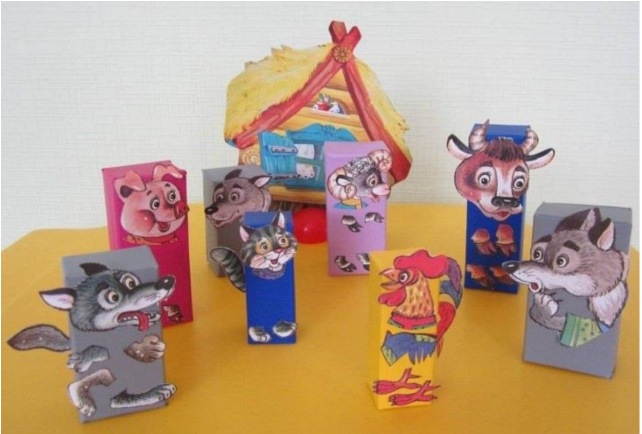
На других различных упаковочных коробках.