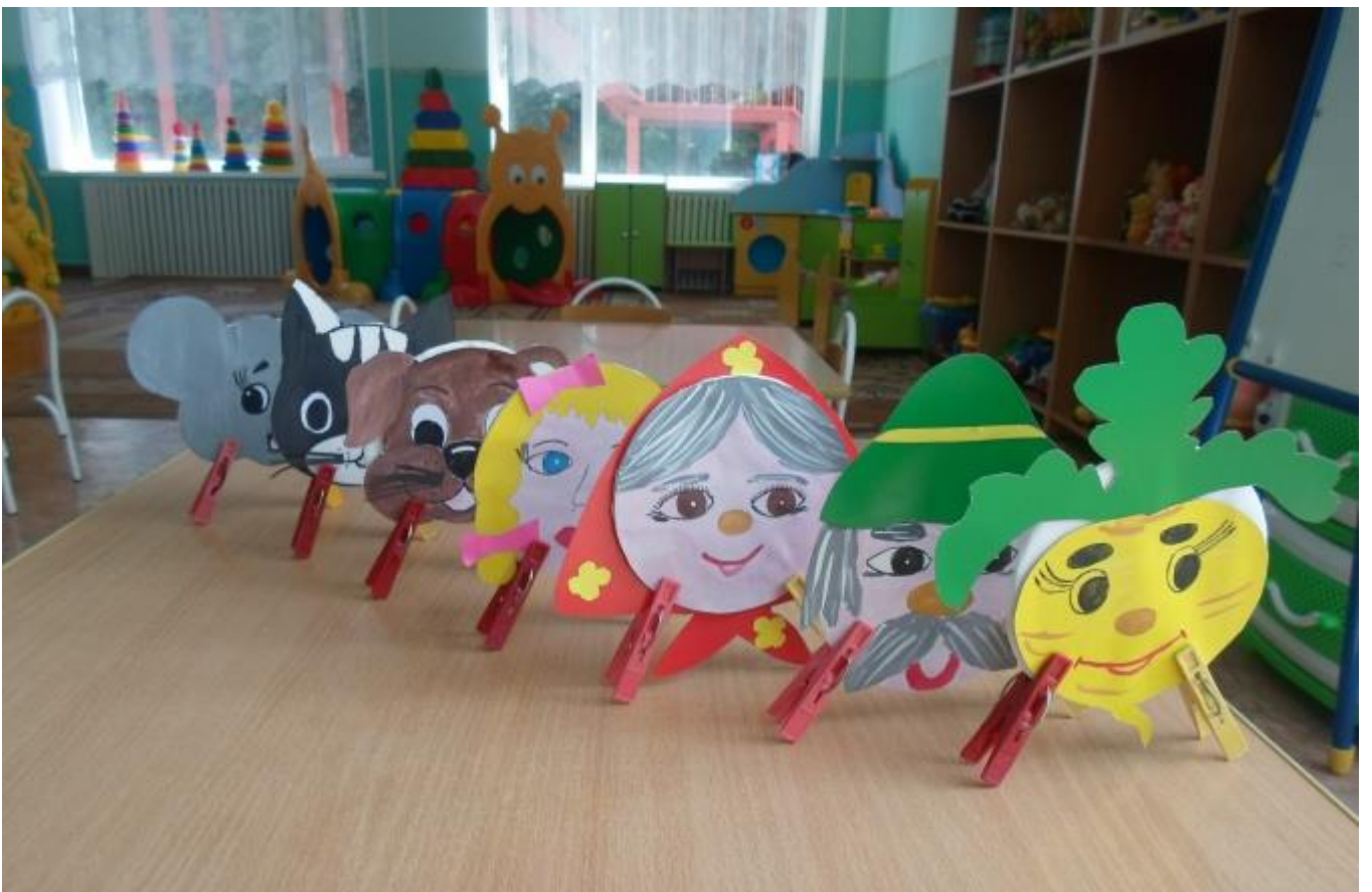
Варианты использования прищепок в театре на столе.