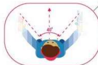
ОПАСНОЕ ТУННЕЛЬНОЕ ЗРЕНИЕ

При переходе проезжей части обязательно держите ребёнка за руку и первым делом научите разворачиваться и смотреть по сторонам: сначала налево, потом направо, а дойдя до середины дороги – снова направо!