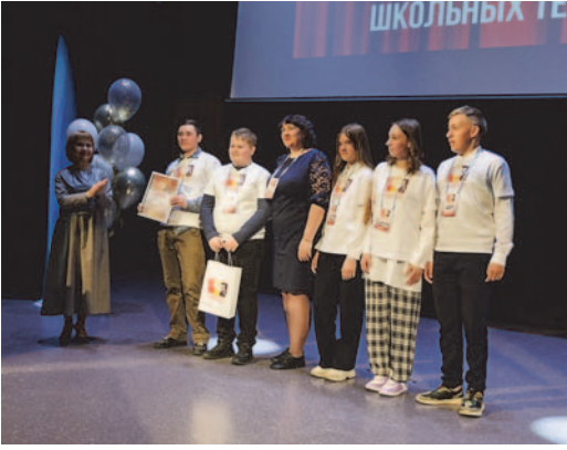
Актив МБОУ "Ильинская ООШ"