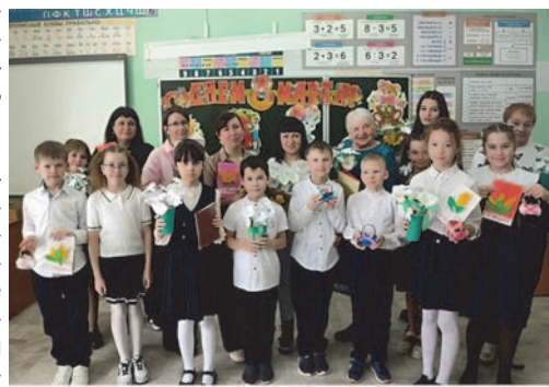
МБОУ "Золотковская СОШ"