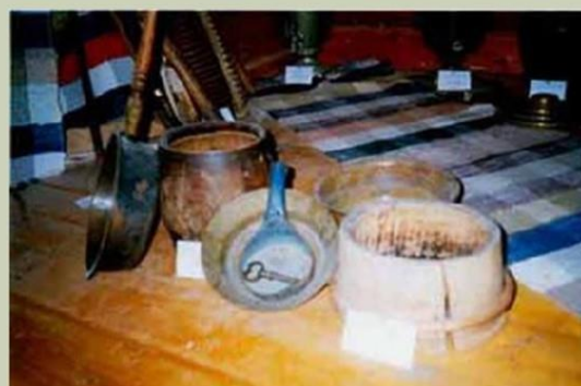
Горшки, кринки, миски